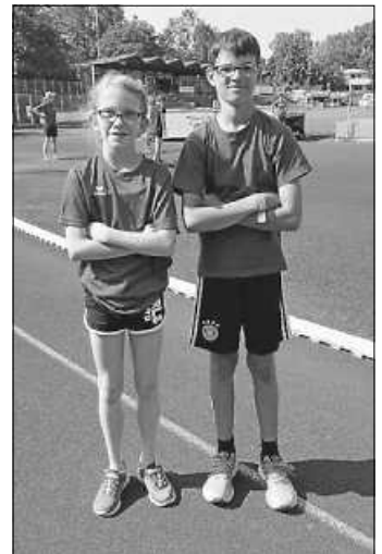
Die Schwieberdinger U14