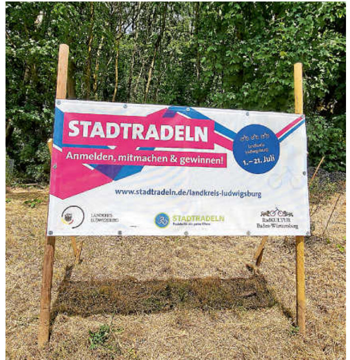
STADTRADELN-Fotopoint Schwieberdingen, Kurve Holdergasse