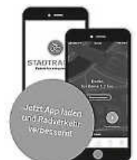
Stadtradeln Grafik: StadtradelnApp