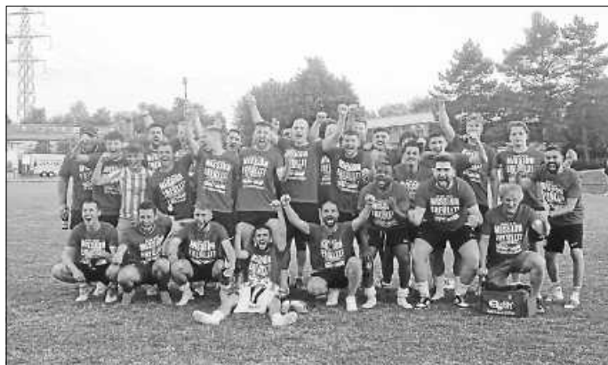
Sieger Relegation TSV Schwieberdingen