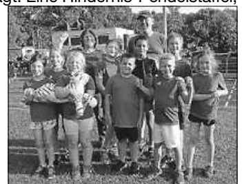
Die Schwieberdinger Tiger