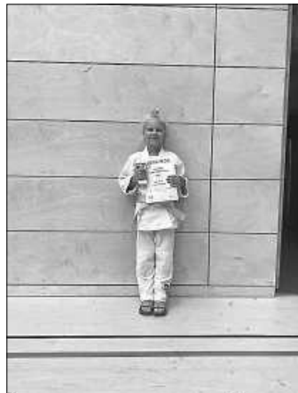
Glückwunsch! Fotos: Judo

Eine fantastische Leistung von allen an diesem Wochenende überhaupt auf die Matte zu gehen und nicht, wie viele andere es wohl gelöst hätten, ins Freibad!