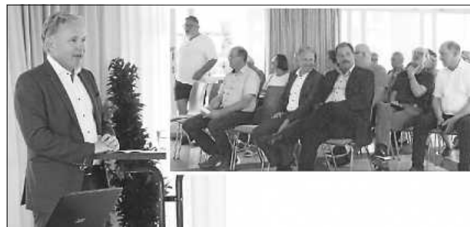
Voll belegter Mehrzweckraum

Am 21.6.23 fand eine Diskussion im Rathaus zur Windenergie in Schwieberdingen statt. Der Pleidelsheimer Bürgermeister und CDU-Kreisrat Ralf Trettner eröffnete die Diskussion über Windkraft mit einem interessanten Vortrag pro Windkraft: Die lokale Bereitstellung grüner Energie sichert Industriestandorte. So plant Bosch zur Energieversorgung des Standorts 2 Windräder. Doch die Wertschöpfung durch Windenergieanlagen sollte in der Gemeinde bleiben. Trettner unterstützt deshalb Bürgerenergiegesellschaften. Ökologie und Ökonomie sind beides wichtige Säulen der Energiewende. Er erhielt sehr viel Beifall von den vielen Zuhörern, darunter auch 7 Schwieberdinger Gemeinderäten.