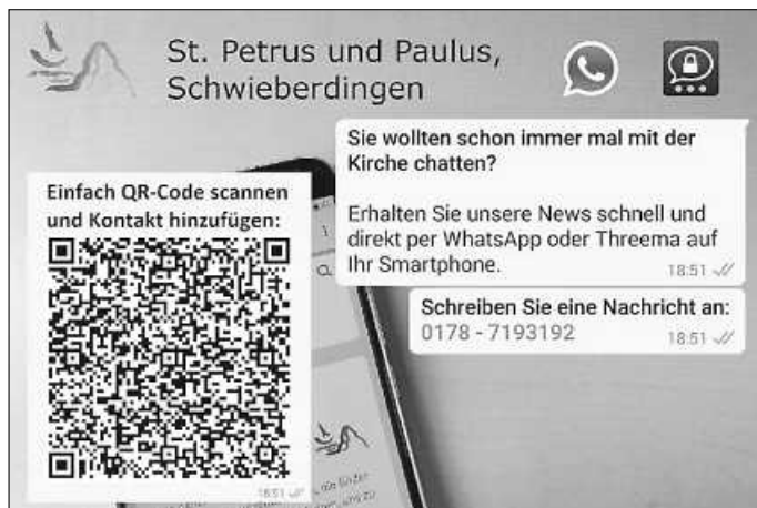
Grafik: St. P&P