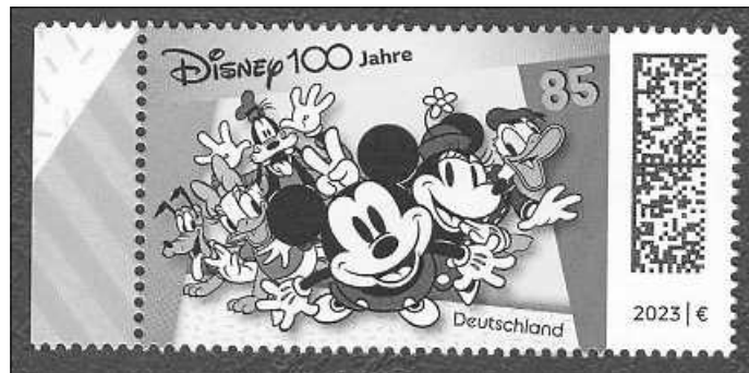
Mickymaus-Marke mit Matrixcode

Das nächste Clubtreffen findet am Mittwoch 12.7.23 ab 19.30 Uhr im TV-Heim Möglingen beim Bürgerhaus statt.